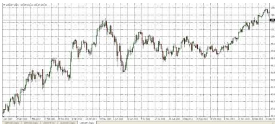
Grafik 1. Pergerakan Harga Pair USD-JPY Selama Tahun 2013